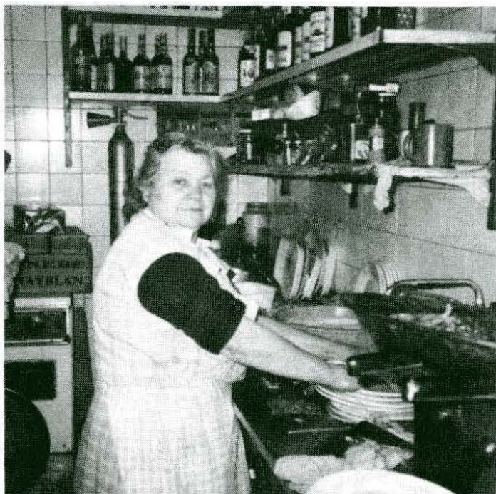
La Dolores, feliç a la seva cuina.