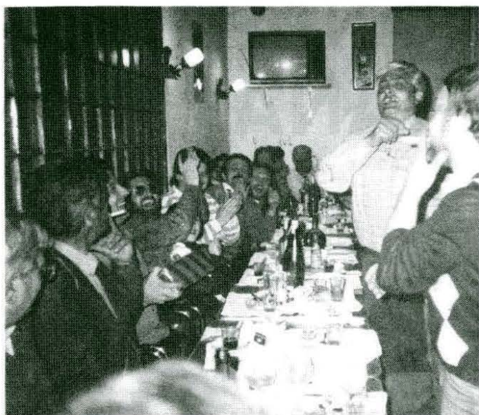
Sopar dels "dominaires".

I és que aquest restaurant ofereix també la possibilitat d'encomanar tota mena de menjars per emportar-se a casa. Sobre tot el diumenge la demanda és molt gran, i especialment d'un plat molt concret: la paella, coneguda ja per tot el poble.