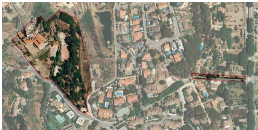
Els dos subàmbits.