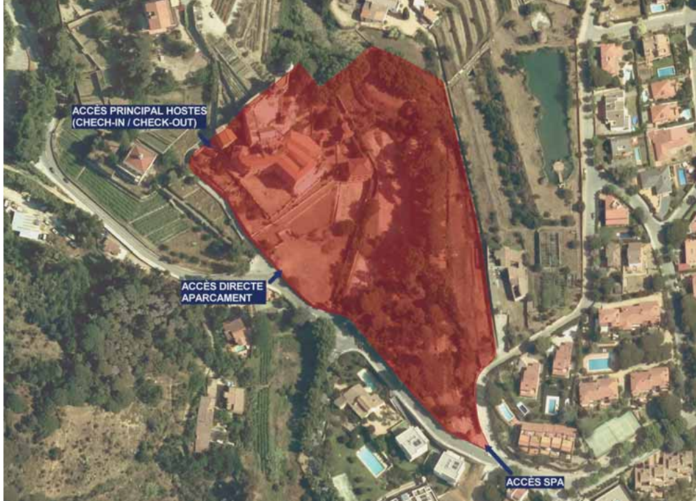
Subàmbit 1: Superfície que formarà part del futur hotel.

a conseqüència de la condició de parcel·la única i indivisible de la zona d'aprofitament privat, la cessió del 10% d'aprofitament urbanístic es preveu que sigui substituïda pel seu valor econòmic en el tràmit del Projecte de Reparcel·lació”.