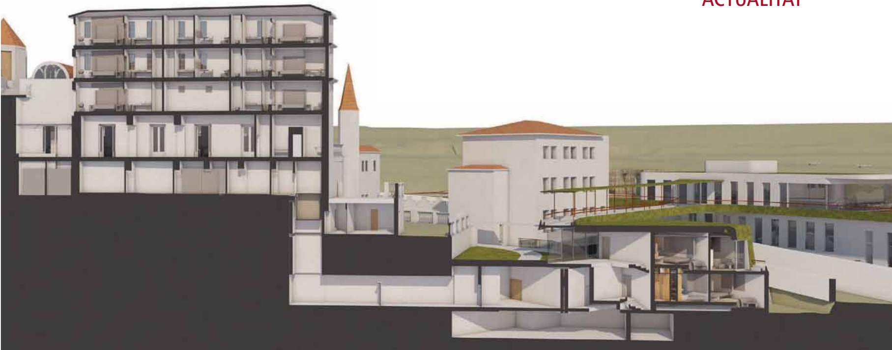
Secció que permet veure l'edifici antic i la part de nova construcció.

es preveu una detallada distribució de funcions per a cadascun dels espais, tant els generats per la rehabilitació com els de nova construcció. Explicar-los tots excedeix la capacitat d'aquest text, així que només en destaquem uns quants exemples: