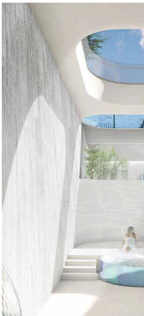
Recreació d'un detall de l'espai clínica de salut i spa.

es preveu una detallada distribució de funcions per a cadascun dels espais, tant els generats per la rehabilitació com els de nova construcció. Explicar-los tots excedeix la capacitat d'aquest text, així que només en destaquem uns quants exemples: