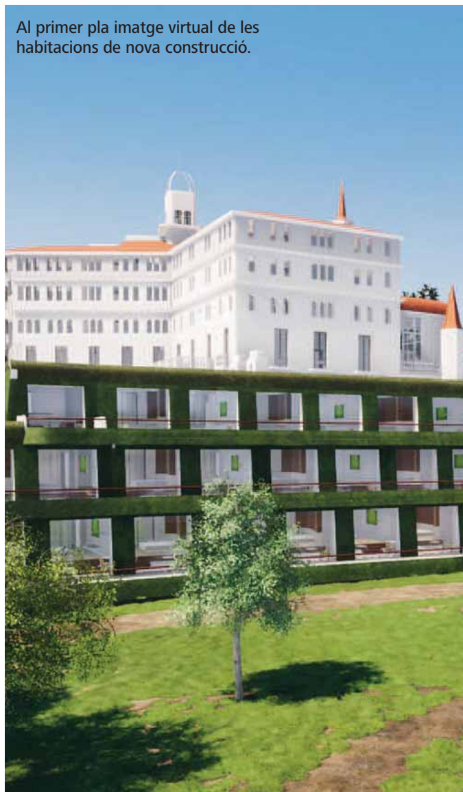
Al primer pla imatge virtual de les habitacions de nova construcció.

La finca va pertànyer a l'Escola Pia fins l'any 2001, i durant aquests noranta anys, es van adaptar tant els edificis com els jardins als usos que es requerien com a escola. Aquest fet va significar una primera pèrdua o transformació d'espais i elements arquitectònics originals.