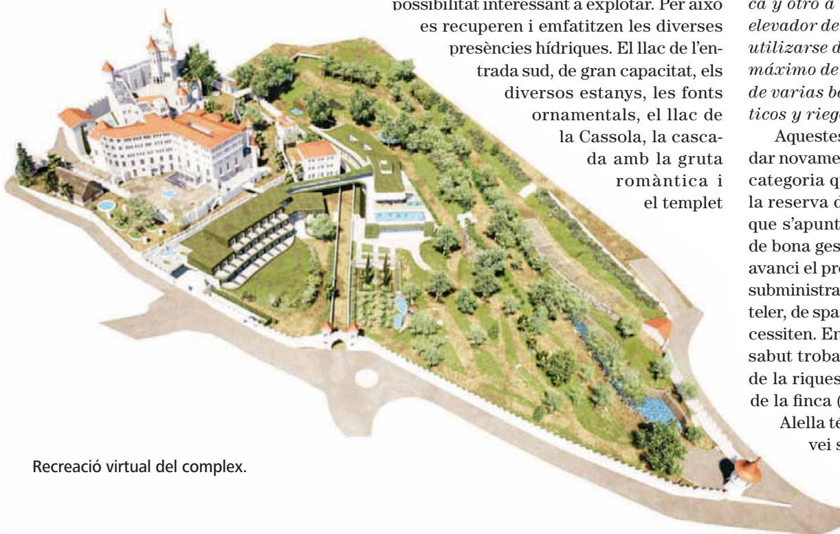
Recreació virtual del complex.

A l'avantprojecte podem llegir: “Una de les característiques principals del lloc és l'abundant presència d'aigua. A més de ser una preexistència històrica, és una temàtica fonamental per reforçar el caràcter Wellbeing del resort relacionat amb la hidroteràpia. A més, com que no està situat en una localització marina o lacustre, la presència de l'aigua es converteix en un gran incentiu, especialment a la costa catalana, amb una localització propera a Barcelona que tothom relaciona amb el mar. La presència d'aigua embassada suposa una possibilitat interessant a explotar. Per això es recuperen i emfatitzen les diverses presències hídriques. El llac de l'entrada sud, de gran capacitat, els diversos estanys, les fonts ornamentals, el llac de la Cassola, la cascada amb la gruta romàntica i el templet