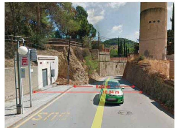
Amplades del carrer Marià Estrada. Al fons el vial a eixamplar.